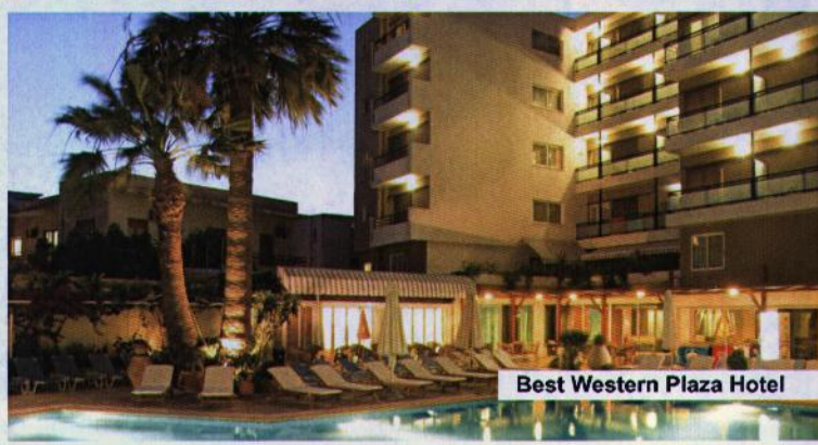
Best Western Plaza Hotel